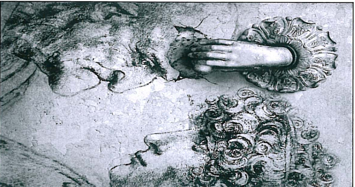
Imagen Ganadora de la II Edición del Concurso de Fotografía ¿Qué es para ti el Alzheimer?