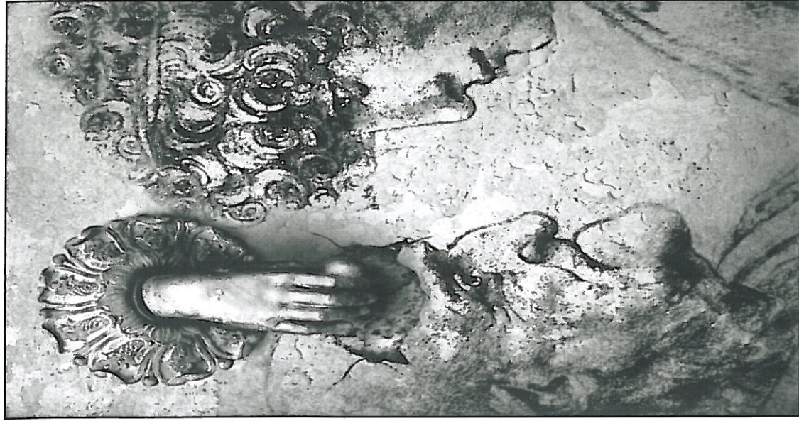
Imagen Ganadora de la II Edición del Concurso de Fotografía ¿Qué es para ti el Alzheimer?