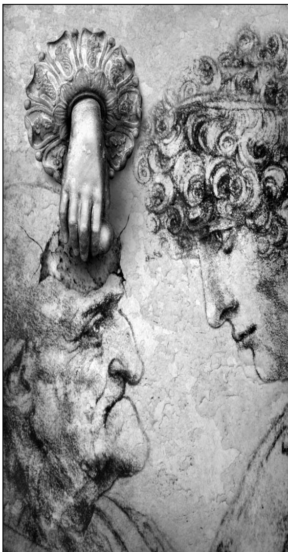
Imagen Ganadora de la II Edición del Concurso de Fotografía ¿Qué es para ti el Alzheimer?

“EL DIAGNOSTICO Y TRATAMIENTO PRECOZ DE LA ENFERMEDAD, ES FUNDAMENTAL PARA LA CALIDAD DE VIDA DEL ENFERMO Y DE SUS FAMILIARES”